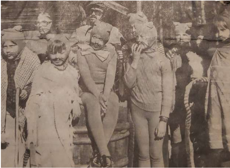
Kuva 149: Ohjaaja ja ohjattavat ”Harjukujan” laitamilla harjoitusten jälkeen. Toistaiseksi askarruttaa - jännittääkin - mutta ensi-illan jälkeen saatetaan jo hymyillä...