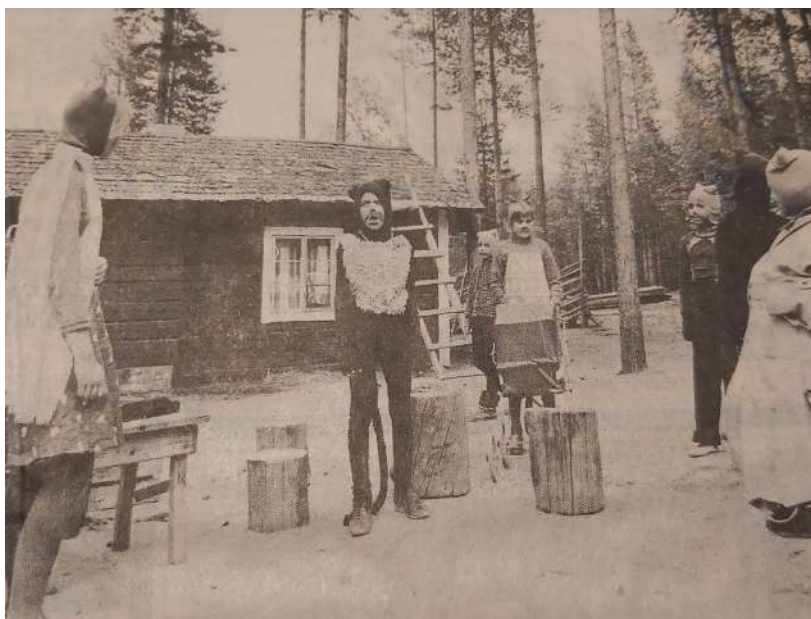
Kuva 151: Kiinteästi toimiva lapsiteatteri on maassamme harvinaisuus: toinen Suomessa toimivista on Kuhmossa. Kuhmon Lapsiteatterin iloinen "Pekka Töpöhäntä" sai ensiesityksensä sunnuntaina Kelon kesäteatterissa.

Kuhmon lapsiteatteri on tullut tänä kesänä täydentämään pitäjän kesäteatteritoimintaa. Lapsiteatterilla oli sunnuntaina Kelolla onnistunut "Pekka Töpöhännän" ensiesitys. Kuhmon lisäksi Suomessa toimii vain yksi lapsiteatteri, Aulangolla. [Hyvä tietovisailukysymys.]