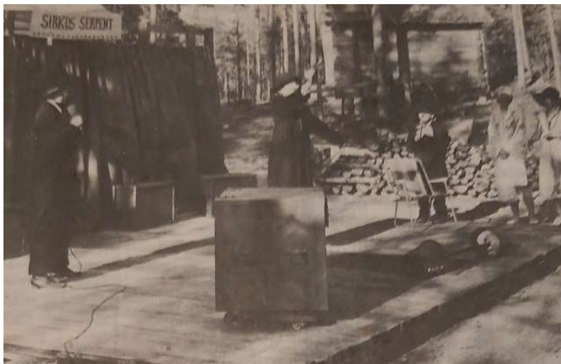
Kuva 170: Sirkuskoiran tarina on vauhdikas esitys, joka sopii hyvin koko perheen katsottavaksi.