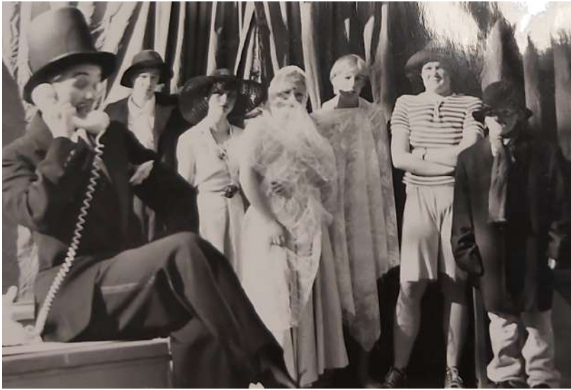
Kuva 171: Sirkustirehtööri, sirkuksenjohtaja hälyttää etsivätoimistosta apua sirkuskoiran löytämiseksi. Soitto johdatti tulokseen ja Linssi ja Lasi löysivätkin Kyljyskolosta etsintäkuulutetut. Sirkuksen väki seuraa mielenkiinnolla tilannetta.

Kuhmon lapsiteatterin tämän kesäisellä näytelmällä ”Sirkuskoiran tarina”, oli ensi-iltansa lauantaina 7.6. Multikankaan kesäteatterissa. Tapahtumarikasta näytelmää saapui seuraamaan valitettavan vähän katsojia.