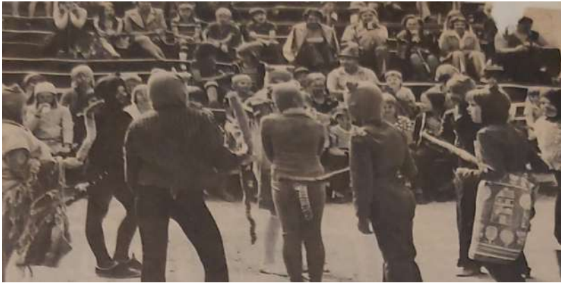
Kuva 150: "Kissan kaunistukset" heiluvat kaareissa - vain Töpöhännän töpö on rauhallisesti paikallaan... Taustalla katsomon pikkuväkeä.

Lastenteatterin näytelmän "Pekka Töpöhäntä" ensiesitys oli Kelolla viime sunnuntaina. Yleisö sai elää hetken todellisia kissan päiviä: ahkera harjoittelu on luonut Harjukujallisen pikku mestareita!